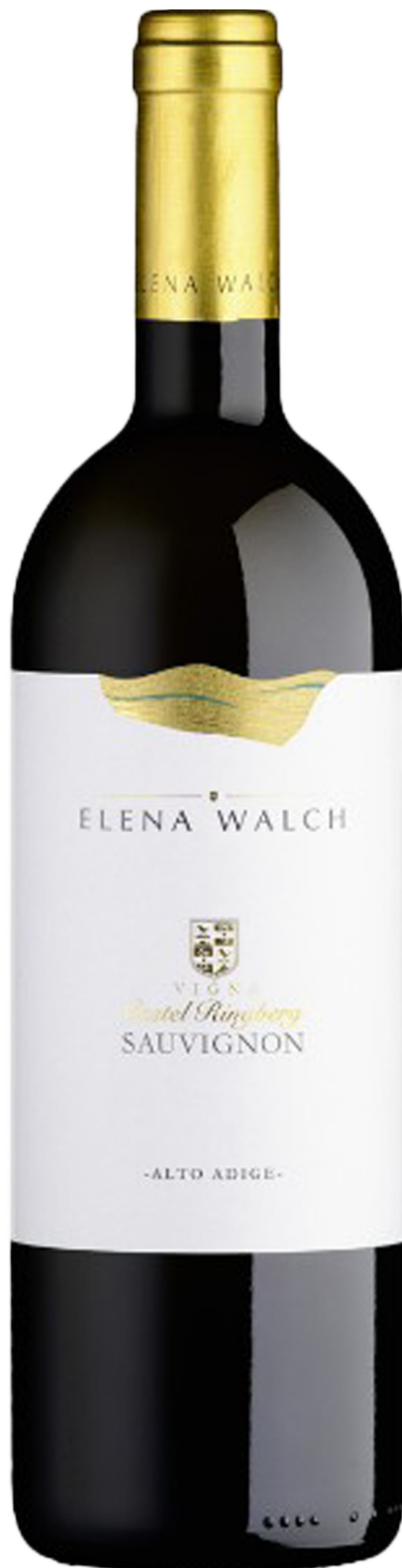
Sauvignon Castel Ringberg 2019, Weingut Elena Walch, 22 Franken; über weibelweine.ch .